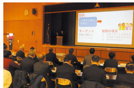
総合的な探究の時間実践報告会(ゲスト多数)