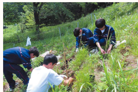
学校の裏山でムラサキの植栽活動

地域とともに学ぶ経験が、生徒の確かな成長につながっています。多くの皆様の支えに心より感謝申し上げます。