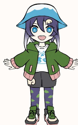
八幡平市イメージキャラクター「ベルフラワー」