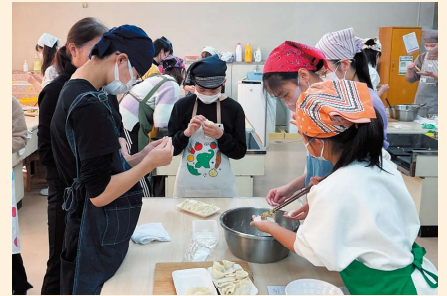
中国人スタッフと学ぶ春節の餃子文化