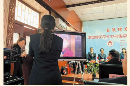
北京市月壇中学生が日本語アフレコ発表

文化の違いの中で子どもと向き合い、地域の方々とつながりながら学ぶ経験は、教員としての視野を確実に広げてくれました。北京で得た学びを生かし、岩手でも子どもたちと共に学び続けながら、「地元も世界もラブ」な姿を共に育んでいきたいと考えています。