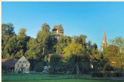
校庭から見えるウスター城と教会

スイスは、ヨーロッパのほぼ中心に位置し、マッターホルンに代表されるアルプスの壮大な山々、美しい川や湖、四季折々に変化する景色を楽しめるハイキングコース等、豊かな自然と牧歌的な風景が広がっています。ドイツ語、フランス語、イタリア語、ロマンシュ語の4つの言語圏からなり、地域ごとに独自の文化や習慣が根付いています。赴任先の学校は、ドイツ語圏であるチューリッヒ州のウスター市にありました。ウスター市は、人口3万人ほどの小さな都市ですが、国際的に活躍する企業が集中していることでも知られています。学校の近くにはウスター城とウスター教会があり、教会の鐘を