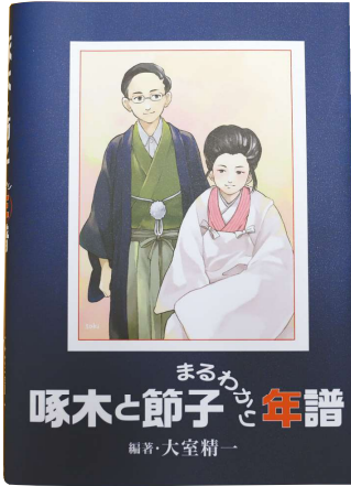
大室 精一 『啄木と節子まるわかり年譜』 (桜出版 2022年)