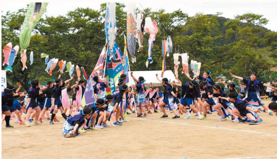
こいのぼり大運動会(末小ソーラン)

5月「こいのぼり大運動会」校庭一杯に万国旗ならぬ「こいのぼり」が泳ぎ、その下で行われる4・5・6年生伝統の「末小ソーラン」は、地域からご寄付いただいた半被を着て堂々と舞う子どもたちの雄姿、圧巻です。