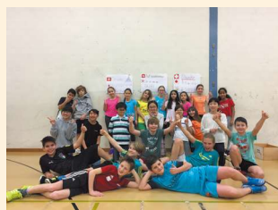
現地校との交流会の様子