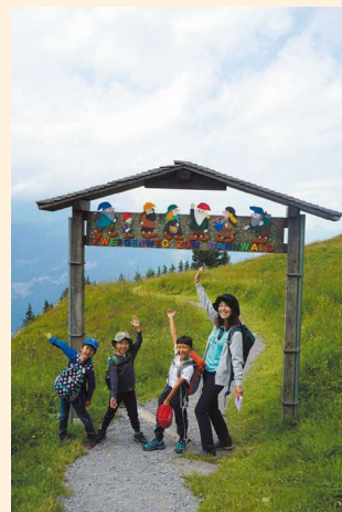
サマーキャンプ 大自然の中をハイキング

赴任した4年間の中で、現地の小・中・高等学校、職業訓練校へ足を運び、スイスの教育事情について話を聞くことができました。その中で、皆同様に語っていたのが「国土が小さく、資源の乏しいスイスにおいては、人材こそが最大の資源であり、教育は国をあげて力を入れていかなければならない最重要課題である。」ということです。その言葉通り、充実した教育環境、教育システムのもと行われるスイスの教育活動から、多くのことを学びました。4年間で学んだことをもとに、これから、日本の未来を担う子どもたちの教育に力を尽くしていきたいと思っています。